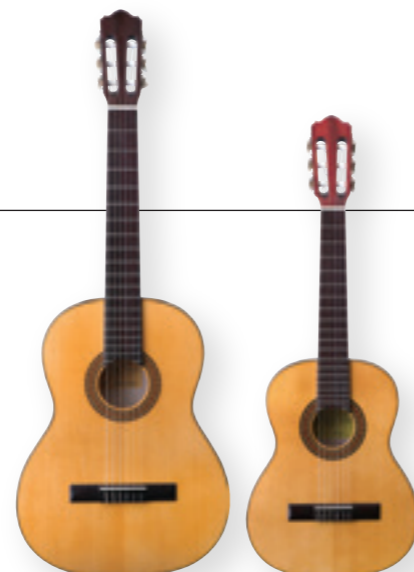
Spanish 4/4 650mm

Spanish 7/8 620mm Spanish 3/4 570mm Spanish 1/2 530mm